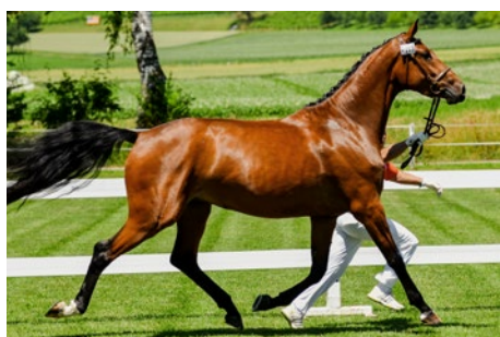
Levinia K CH

Bei allen Fragen oder Problemen hilft Ihnen unser Team in Avenches gerne: Geschäftsstelle ZVCH, Montag bis Freitag, 8.00–11.30 Uhr, 026 676 63 40, oder info@swisshorse.ch