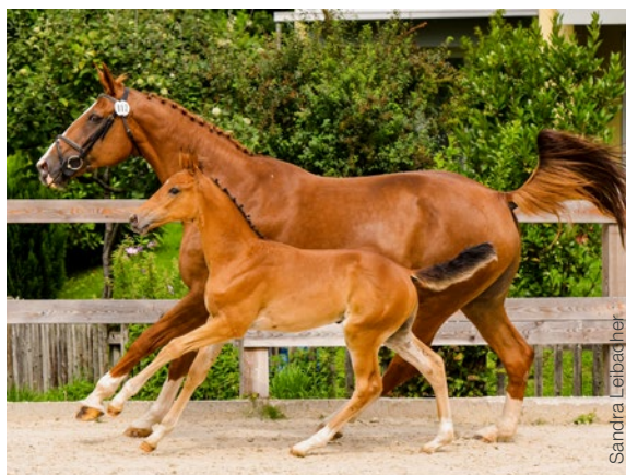
Kennedy vom Eggwil CH

Gérance FECH lundi au vendredi 8h00-11h30 026 676 63 40 ou info@swisshorse.ch