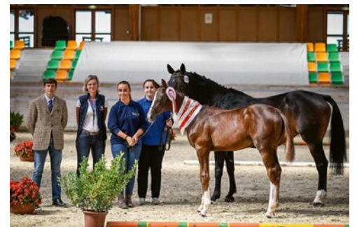
ACK Estivo CH