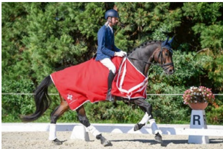
Sir Donovan Live CH