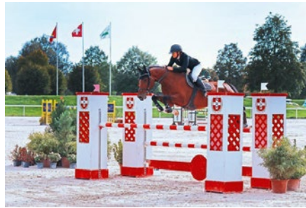
Lipstick PI CH