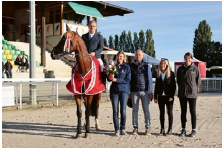
l'm Specia H CH