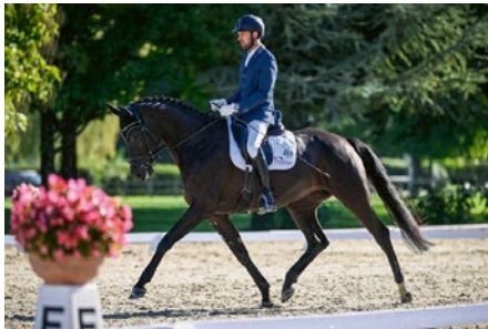
Amica Grande KWG CH