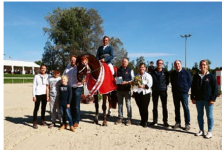
TRS Guapo CH