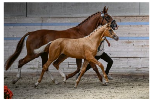
Quesito Oro de Oxalis CH