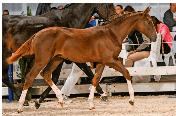
Kuliko Jana CH erreichte den Spitzenpreis in Roggwil. Kuliko Jana CH a atteint le prix le plus élevé à Roggwil.

Après deux ans, le public a également pu assister en direct à la vente aux enchères de poulains de sport LW – cette fois dans l'arène équestre de Roggwil (BE). Là aussi, le CO s'est montré satisfait du résultat du chiffre d'affaires total de 225'000 francs pour 23 poulains vendus, ce qui donne un prix moyen de 9'804 francs. Au total, 27 poulains étaient proposés, la plupart provenant du «Luzerner Warmblutpferdezucht», dont cette vente aux enchères de poulains, la plus ancienne de Suisse, est également issue, et un petit contingent du syndicat d'élevage chevalin de Berne-Mittelland. Lors de cette vente aux enchères, un prix minimum est fixé depuis toujours avec les vendeurs pour l'obtention du droit d'adjudication. De même, seuls les poulains de la FECH sont admis. Ici aussi, le prix le