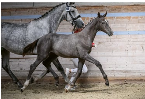
Sir Donnerhall's Unique Saga CH