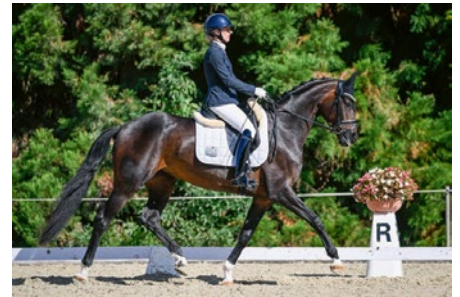
Dancira ZFK CH