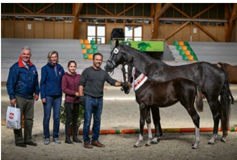
Diamantina ZSH CH