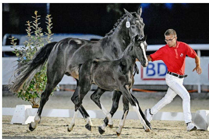
Diamantina ZSH CH schwang in Dielsdorf obenaus. Diamantina ZSH CH a pris le dessus à Dielsdorf.