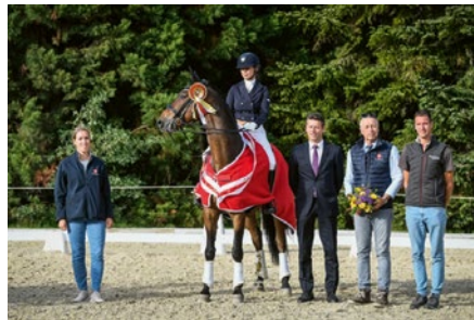
Ricciolo von Buchmatt CH