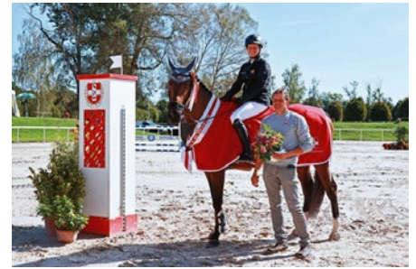
Othello vom Eigen CH