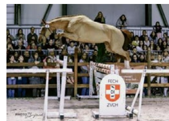
Bagheera de l'Étang CH v./p. Balou du