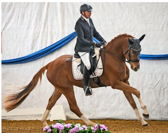
Rietenberg's Camira CH steigerte sich vom vierten Zwischen- auf den zweiten Schlussrang. | Rietenberg's Camira CH est passée de la quatrième place intermédiaire à la deuxième place finale.