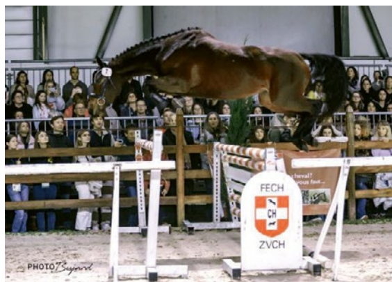
Gioya CH – Rang 3 ex. v./p. Glasgow-W van het Merelsnest -