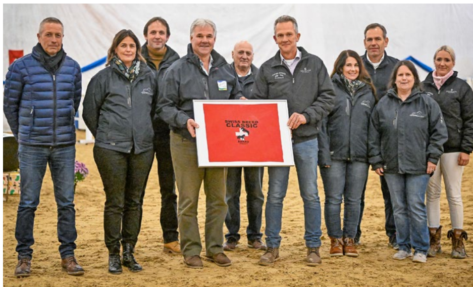
Ehrung für die Bremgartner und Übergabe an die Ostschweizer Hommage aux organisateurs et remise aux Suisses orientaux