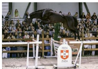
Caya R CH