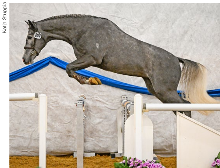
Der Schimmelhengst Cristobal K CH wurde Zweiter im Freispringen. L'étalon gris Cristobal K CH s'est classé deuxième au Saut en liberté.