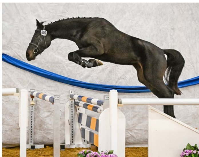
Nur fliegen ist schöner: Springsiegerin Caya R CH Seul voler est plus beau: la gagnante du Saut d'obstacles Caya R CH.