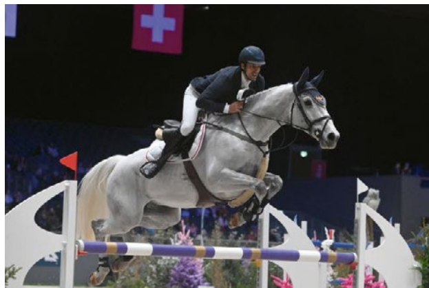
Elastic Vert CH – Rang 2 v./p. Curtis Sitte - Gervantus II - Elf III Z./E. : Werly Michel, Lignerolle / B./P. : rsg-sportpferde, Dettighofen (DE) R./C. : Pichierra Moreno, Seon