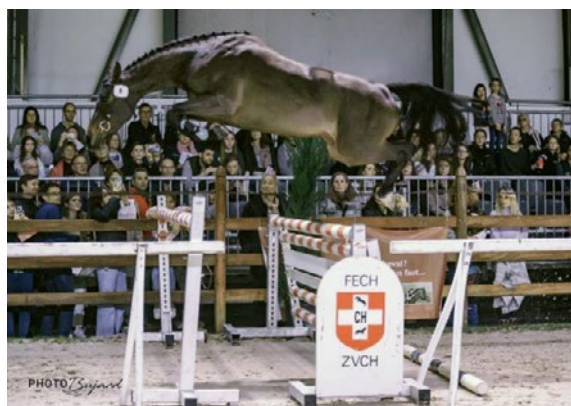
Zora vom Quellhof CH – Rang 1