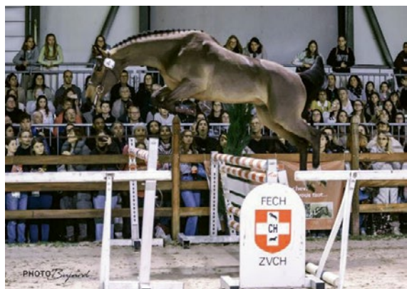
Chalaco CH – Rang 3 ex. v./p. Conteur - Reichsgraf – Comet

Z./E. : Krebs Fritz, Rüeggisberg / B./P. : Krebs Fritz, Rüeggisberg