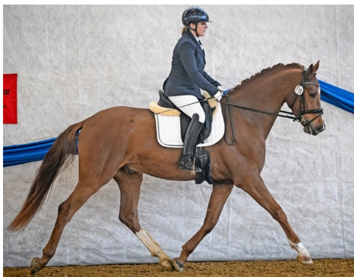
Die weisse Siegsschleife bei den Grundgangarten holte sich Safir von Buchmatt CH. | Safir von Buchmatt CH a remporté l'écharpe blanche de la victoire dans les allures de base.