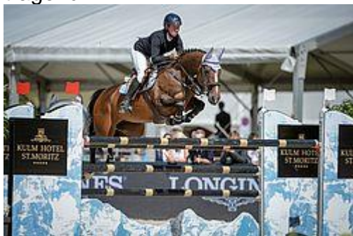
Die 12-jährige Gräfin vom Eigen CH (v. Galant Normand x Voeu de Bonneville) unter Barbara Schnieper am Fünfsterne-CSI in St. Moritz. Foto: Katja Stuppia

Reportage & Fotos v. Angelika Nido Wälty