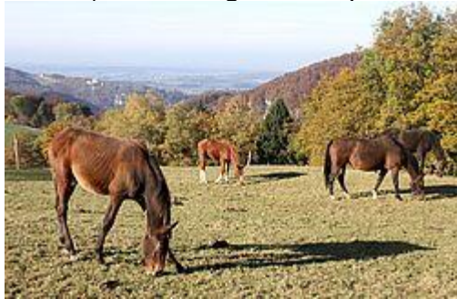
Eigenhof-Stuten mit Fohlen – von den zehn Zuchtstuten sind zurzeit sieben tragend.