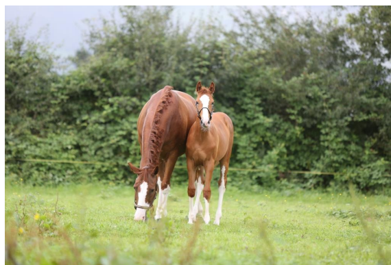
Genua VIII CH v. Gagneur du Pichoux – Aristocrate mit Fohlen Cora Rubin v. Couleur Rubin geb. 2014.

«Unsere Züchter öffnen für Sie Stall und Hof!» - unter diesem Motto möchte der ZVCH die CH-Sportpferdezucht einem breiten, interessierten Publikum näherbringen. Im Fokus stehen die Züchter, die mit viel Herzblut, Risikobereitschaft und Liebe zur Sache für den vierbeinigen Nachwuchs für die Sport- und Freizeitreiter sorgen.